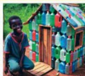
La Imaginación es ilimitada. Este niño construye su casa con botellas plásticas desechables. Tomada de la Red de WhatsApp