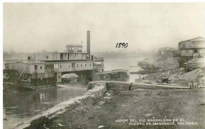
Vapor en el Puerto de Magangué Siglo XIX