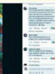
Con la navidad llega el rido de voladores que acosa el oído de los perritos.