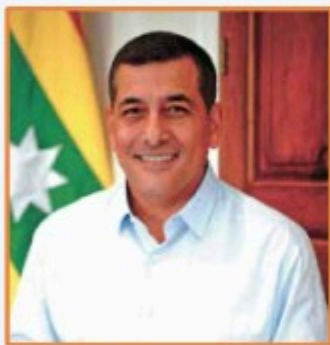
Dr. Dumex Turbay Paz Alcalde Mayor de Cartagena de Indias

El alcalde de Cartagena, Dumex Turbay, aseguró que la tarifa de Transcaribe no subirá en 2025, a pesar del déficit financiero que enfrenta el sistema de transporte masivo. La declaración la dio luego de que Ercilia Barrios Flórez, gerente de TRANSCARIBE, sugirió que un incremento en el pasaje era necesario para cubrir los crecientes costos operativos, particularmente debido al aumento en el precio del combustible que utiliza la flota de buses.