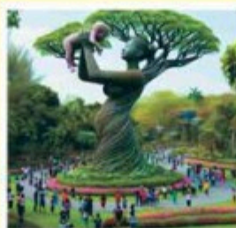
La Madre Naturaleza muestra el fruto de su existencia: La Vida.